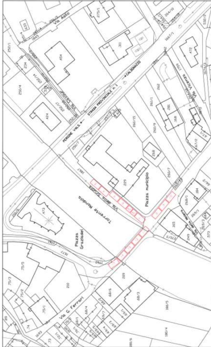
PLANIMETRIA ② MERCATO DI SERVIZIO 2 DAL 10/06 AL 31/08 PIANTINA MERCATO STAGIONALE DIURNO DEL GIOVEDÌ